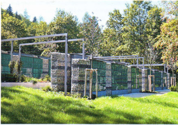
Paul Wolff GmbH (Z)

Gabionenwände mit Urnenelementen bilden das neue Kolumbarium auf dem Friedhof in Tuttlingen.